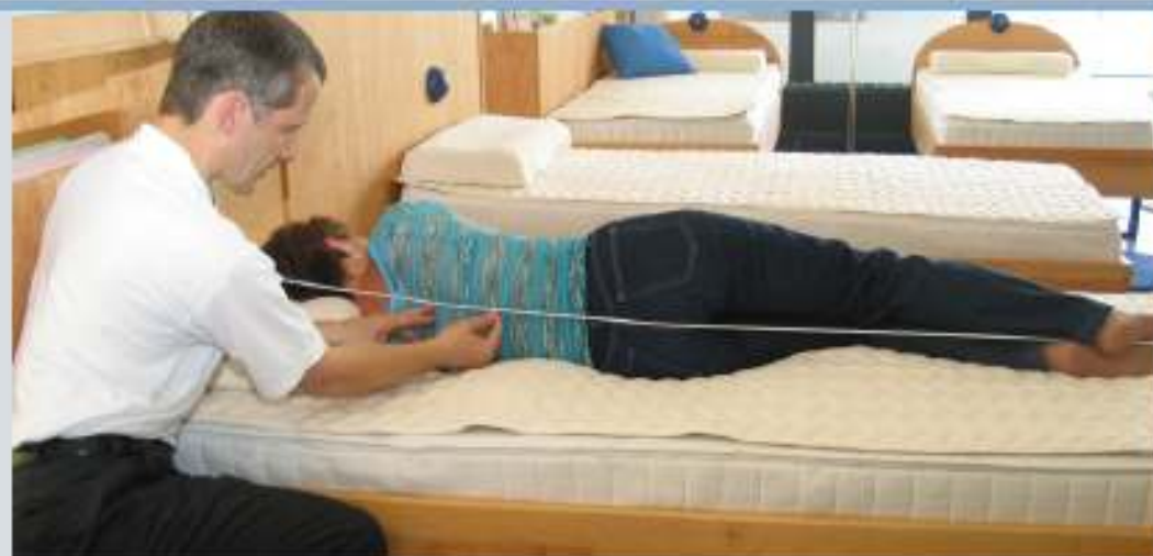
Beim "Physiologischen Matratzetest" am Liege-Simulator erfährt man, welche Matratze der eigene Körper für bestmögliche Erholung benötigt.

Ein vom Institut Proschlaf im Ärztezentrum SM Salzburg entwickelter Test wird ab sofort kostenfrei bei "Das Betten Haus" in Herne angeboten und hilft jedem Konsumenten, genau jene Matratze zu finden, die sein Körper für einen erholsamen und schmerzfreien Schlaf braucht.